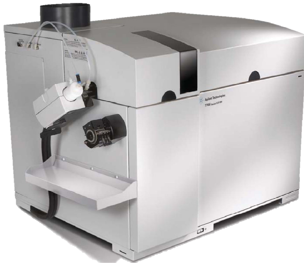
感應耦合電漿質譜分析儀 ICP-MS