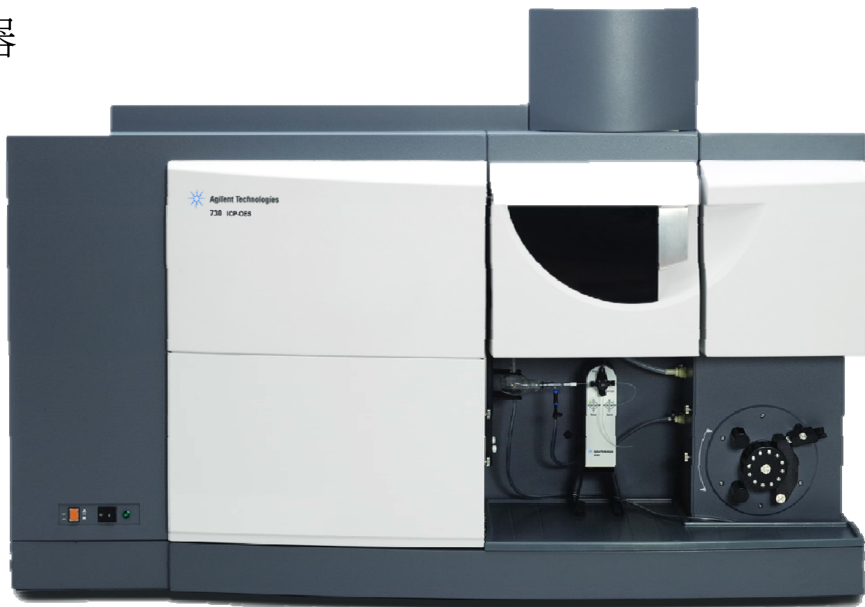
感應耦合電漿發射光 ICP-OES