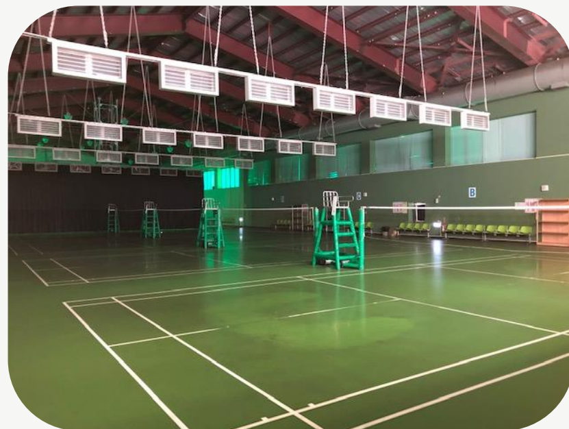
羽球場 排球場 籃球場